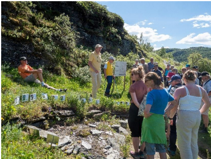
Fra jubileumsfeiringen til Kongsvoll botaniske fjellhage