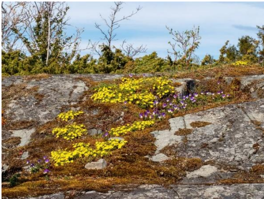
Vårmure med mer på Flatholmen, Malvik

15. september Sopptur i Folla, Steinkjer I samarbeid med fagforeningen Naturviterne. Godt oppmøte av studenter og utvekslingsstudenter.